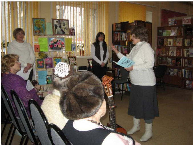
На фото: слушатели библиотеки с интересом слушают выступление Тамары Зыкиной.